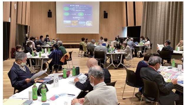
富山県朝日町・野々市市民生委員児童委員協議会視察交流 R4.10.5

に努めてまいります。 また、委員としての活動範囲や趣旨に諸先輩方より若干の指導も促され、少し前のめり過ぎではないかとの指摘も受けています。皆様にご指導いただければ真摯に受け止め活動に努めてまいります。 また、委員としての活動範囲や趣旨に諸先輩方より若干の指導も促され、少し前のめり過ぎではないかとの指摘も受けています。皆様にご指導いただければ真摯に受け止め活動に努めてまいります。 ただの方や相談された方も多く、その経験を活かし委員として福祉で、再度地域のお役に立てればと考えています。特に、子どものいじめや不登校、ひきこもりなどは、今まで目の当たりにしてきたため関心が高く、委員会は児童福祉委員会でお願いをしました。