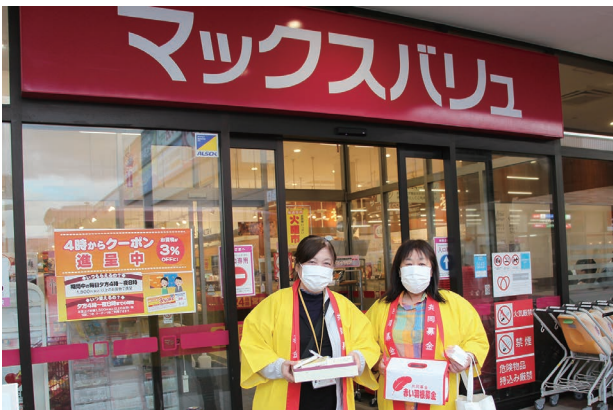
赤い羽根共同募金街頭募金 R4.10.11