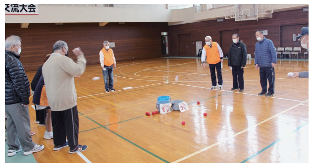
野々市市障害者スポーツ交流大会 R4.11.16