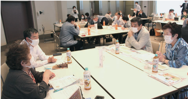
富山県南砺市・野々市市民生委員児童委員協議会視察交流 R4.6.14