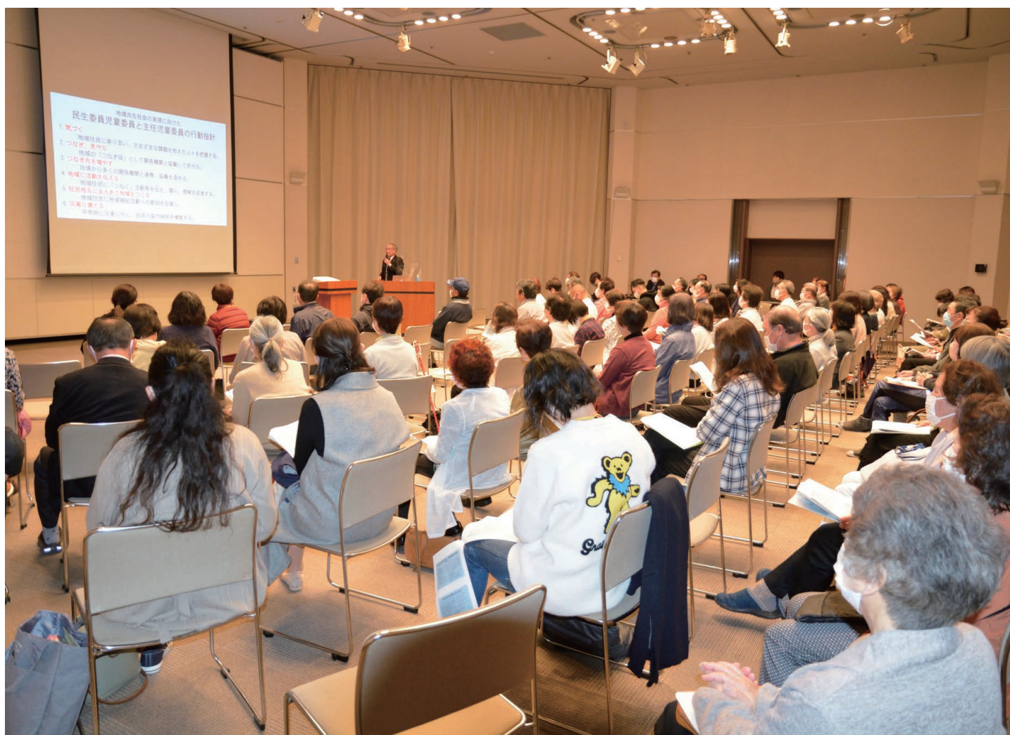
民生委員・児童委員及び地域福祉推進員合同研修会開催!!